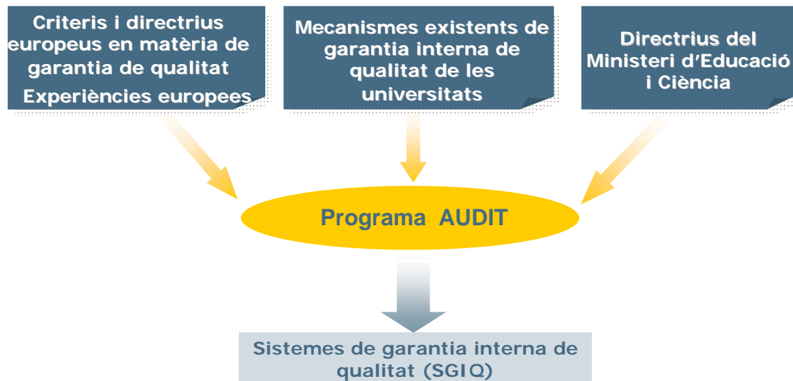
Figura 3: Elements que interactuen en el programa AUDIT

Tal com es recull a la figura 3, en l'elaboració del programa AUDIT s'han pres en consideració els sistemes de garantia de qualitat presents en l'actualitat a les universitats espanyoles, derivats en bona mesura dels programes d'avaluació orientats a la millora duts a terme durant la darrera dècada, i també les directrius del MEC, els criteris i directrius europeus en matèria de garantia de qualitat i les experiències de les universitats europees en aquest àmbit.